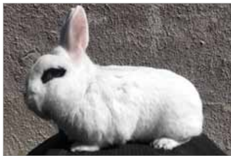
Hototský bílý

Jelikož naše staré sociální zařízení nevyhovovalo dnešním požadavkům, bylo na výroční schůzi schváleno vybu-