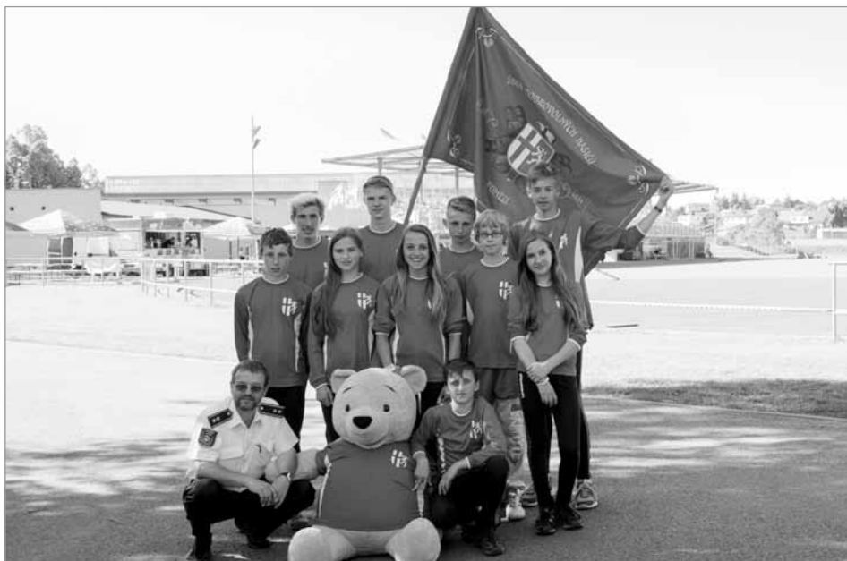
Družstvo starších žáků SDH Pomezí

ni lize Svitavska, stejně jako mladým hasičům, nevyšel začátek sezóny ani jednomu z týmu našich mužů. Přesto se i muži postupně dostali mezi nejlepší týmy okresu Svitavy. Běčko sbíralo body pravidelně a vyhrálo závod v Kamenci, A tým byl na stupních vítězů jako třetí tým závodů v Telecím a v Jevíčku, závod