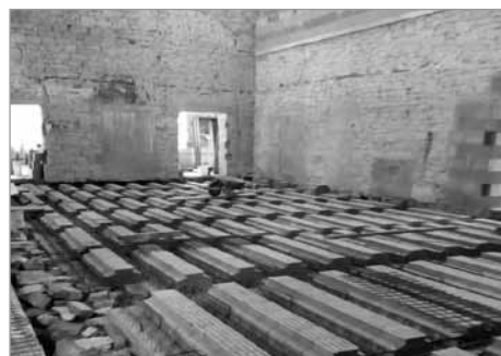
Příprava na betonování podlahy sokolovny

Zastupitelstvo obce Pomezí neschvaluje prodej části p. č. 5895. Stavební pozemek bude po vybudování inženýrských sítí nabízen k prodeji dle pořadí došlých žádostí.