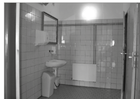
Sociální zařízení KD před rekonstrukcí

Poslední červencový den byla dokončena rekonstrukce sociálního zařízení v kulturním domě.