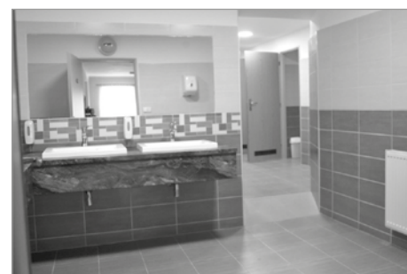
Sociální zařízení KD po rekonstrukci

Celkové náklady na rozšíření sociálního zařízení vyšly na 589 000 Kč, z toho dotace z POV Pardubického kraje činila 110 000 Kč. Zároveň došlo k výměně dveří do dalších prostor kulturního domu.