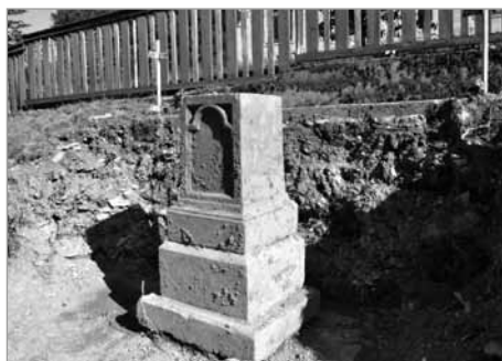
Nalezený podstavec sochy sv. Jana Nepomuckého

S žádostí o dotaci z Ministerstva zemědělství ČR z programu 12966 – Údržba a obnova kulturních a venkovských prvků jsme byli úspěšní.