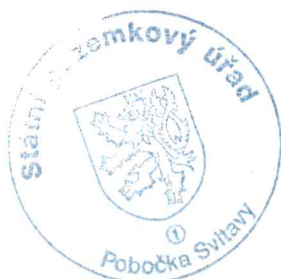
Ing. Miloš Šimek vedoucí Pobočky Svitavy Státní pozemkový úřad

Na tomto jednání budou účastníci seznámeni s účelem, formou a předpokládaným obvodem pozemkových úprav. Bude projednán postup při stanovení nároků vlastníků a případné další otázky významné pro řízení o pozemkových úpravách. Dále bude zvolen sbor zástupců vlastníků pro pozemkové úpravy včetně jednoho náhradníka sboru (ust. § 5 odst. 5 a 7 zákona).